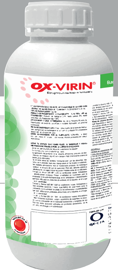
Ox-Virin 1 Kg con tapón